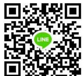
QR code กลุ่ม